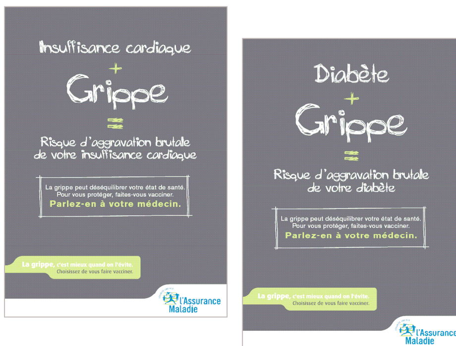
Exemples d'affiches destinées aux salles d'attente des médecins spécialistes / cardiologues à gauche, endocrinologues à droite.

Objectif : susciter le dialogue entre les médecins spécialistes et les patients, en leur faisant prendre conscience des risques encourus et de la nécessaire vigilance qu'entraîne leur pathologie.